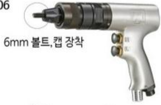
6mm 볼트, 캡 장착